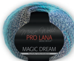
Farbe Nr. 84