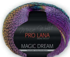
Farbe Nr. 83