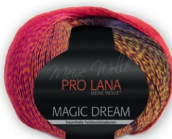
Farbe Nr. 81