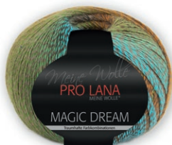
Farbe Nr. 80

75% Schurwolle superwash 25% Polyamid Lauflänge 800m/200g Nadelstärke 2,5 – 3,5