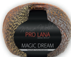
Farbe Nr. 82